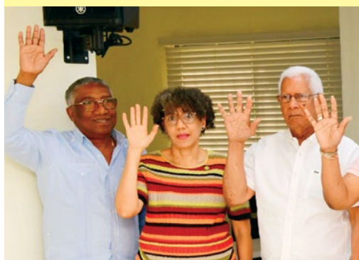
Comité de Disciplina